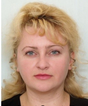
Основні публікації за останні 3 роки