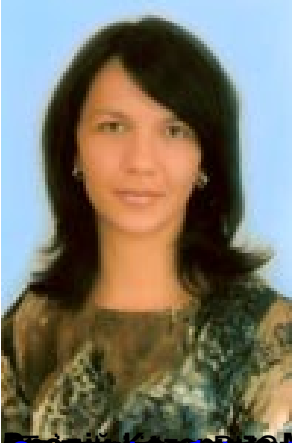
Основні публікації за останні 3 роки - Методичні рекомендації до програми «Процес навчання у дошкільній освіті»