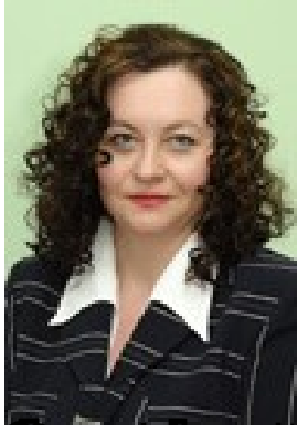
Основні публікації за останні 3 роки