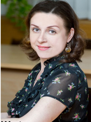
Основні публікації за останні 3 роки - Програма дошкільної освіти дітей з особливими освітніми потребами ; Працює