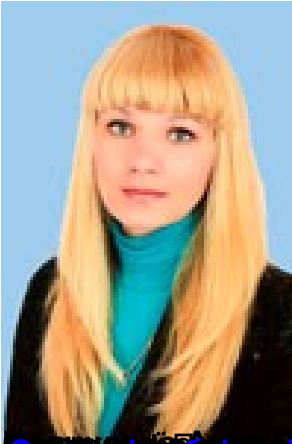
Основні публікації за останні 3 роки - Методичні рекомендації до програми «Процес навчання у дошкільній освіті»