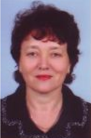
Основні публікації за останні 3 роки - Методичні рекомендації до програми «Процес навчання у дошкільній освіті»