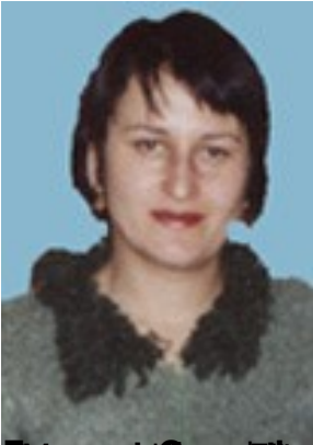
Основні публікації за останні роки Методика роботи з дітьми з особливими потребами Покорі,